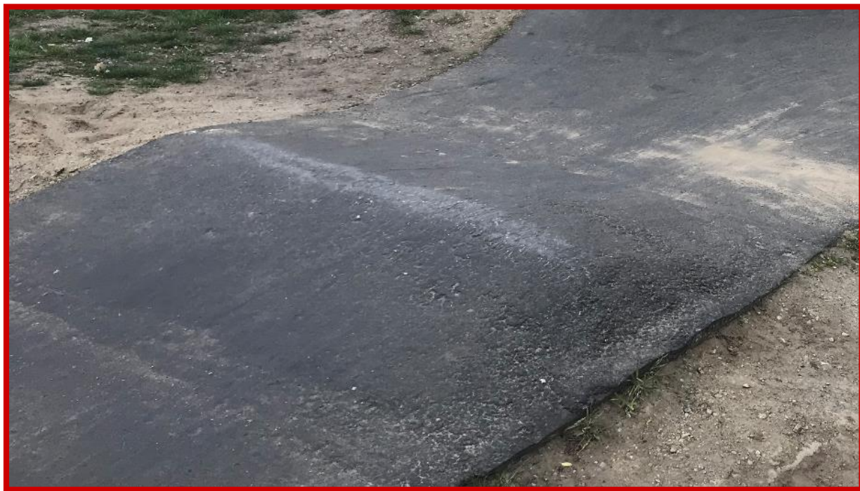
Niepoprawnie wykonany garb – o licznych nierównościach i złym kształcie

Budowa torów typu pumptrack wraz z placami do wypoczynku i elementami małej architektury w ramach zadania pn.: „Zagospodarowanie działki nr 149/4 obręb Komorowo z przeznaczeniem na tereny rekreacyjno-sportowe”