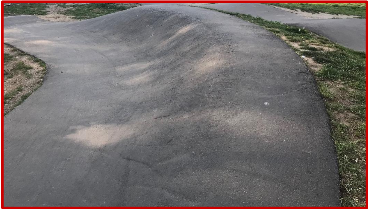
Nieprawidłowa powierzchnia nawierzchnia asfaltowa – nadmiernie chropowata z widocznymi rysami i nierównościami

Budowa torów typu pumptrack wraz z placami do wypoczynku i elementami małej architektury w ramach zadania pn.: „Zagospodarowanie działki nr 149/4 obręb Komorowo z przeznaczeniem na tereny rekreacyjno-sportowe”