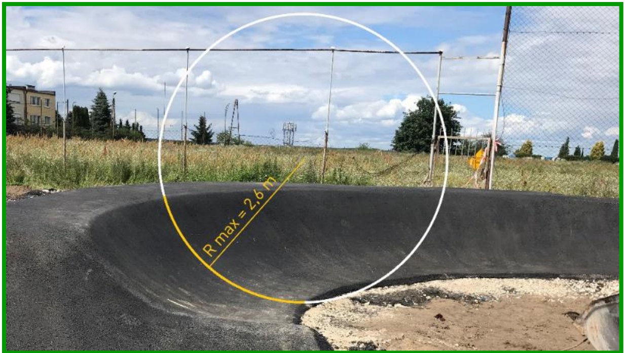
Prawidłowo wykonany zakręt profilowany, którego przekrój stanowi wycinek koła.