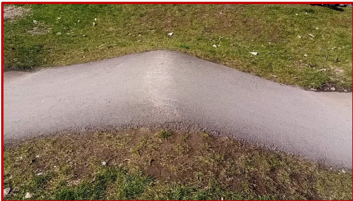
Niepoprawnie wyprofilowany garb – podjazd i zjazd płaski, szpiczasty kształt przeszkody