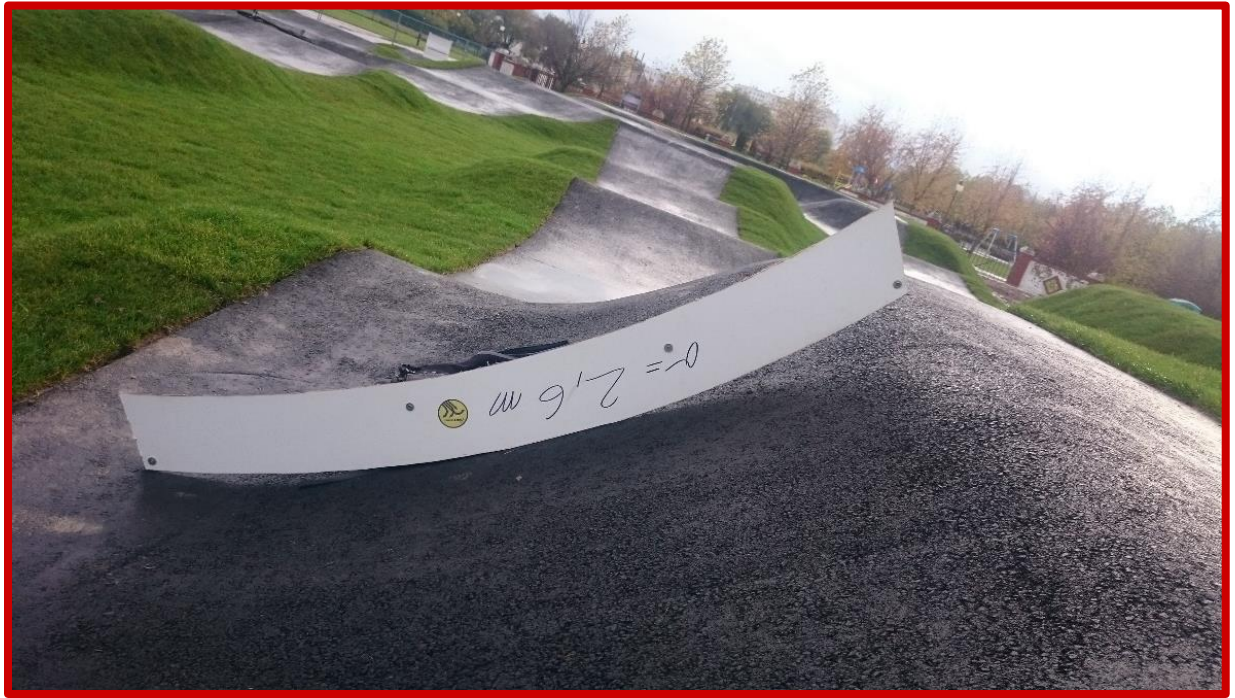
Nieprawidłowo wykonany zakręt profilowany, którego przekrój nie stanowi wycinka koła.

Budowa torów typu pumptrack wraz z placami do wypoczynku i elementami małej architektury w ramach zadania pn.: „Zagospodarowanie działki nr 149/4 obręb Komorowo z przeznaczeniem na tereny rekreacyjno-sportowe”