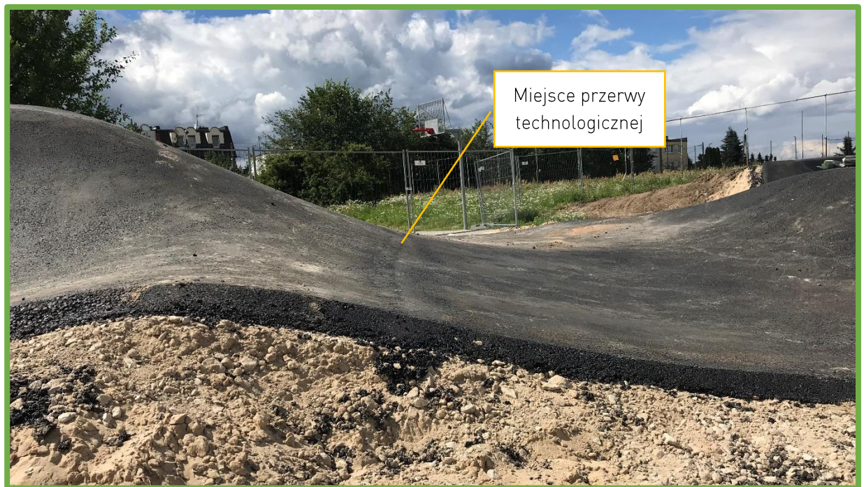
Prawidłowo wykonane połączenia – bez wyczuwalnych uskoków ani zmian profilu przeszkody.