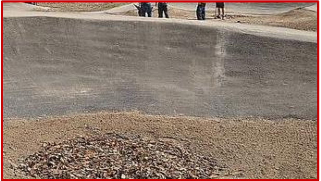
Nieprawidłowe połączenie nawierzchni jezdnej w miejscu przerwy technologicznej

Budowa torów typu pumptrack wraz z placami do wypoczynku i elementami małej architektury w ramach zadania pn.: „Zagospodarowanie działki nr 149/4 obręb Komorowo z przeznaczeniem na tereny rekreacyjno-sportowe”