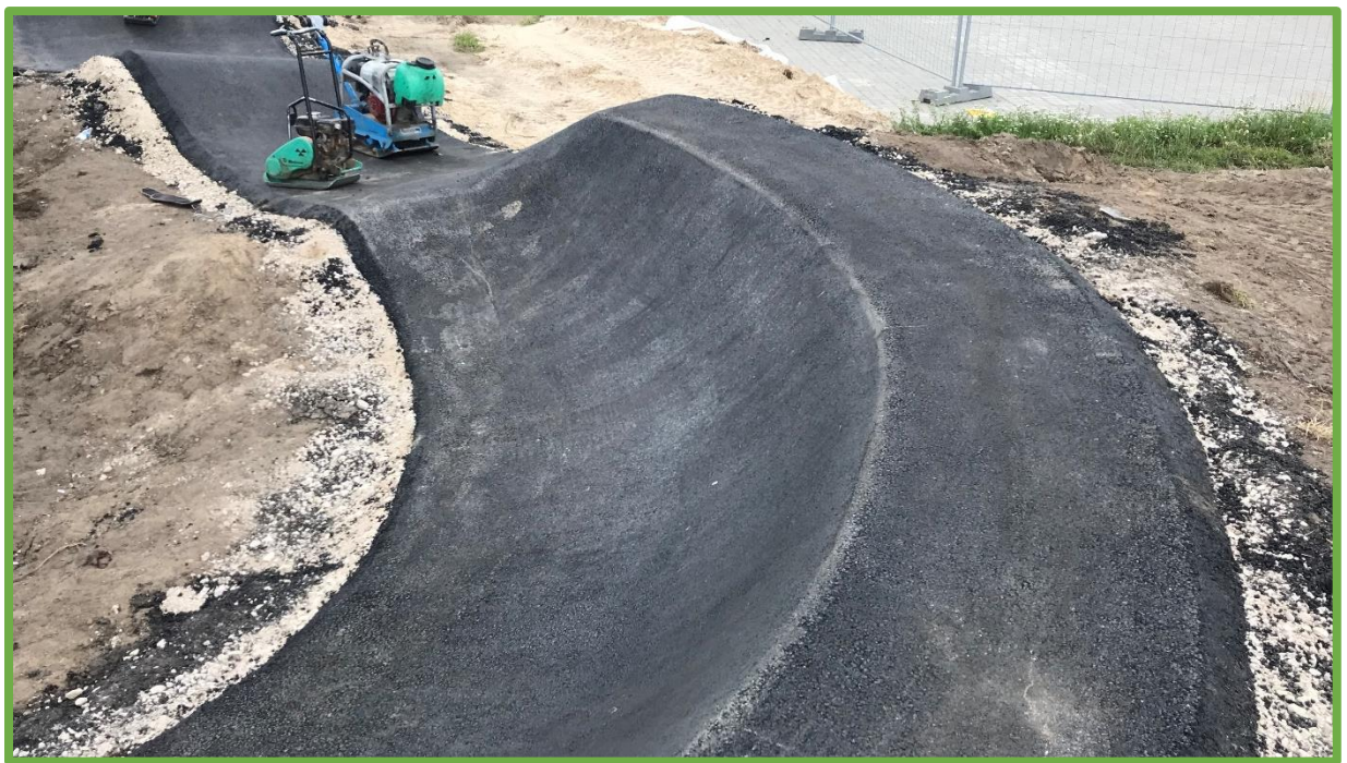
Prawidłowo wykonana nawierzchnia asfaltowa – jednorodna i gładka.

Wszystkie przeszkody wchodzące w skład toru pumptrack (garby, muldy, przeszkody złożone itp.) muszą być wyprofilowane w taki sposób, aby umożliwiały płynną jazdę. Niedopuszczalne jest wyprofilowanie przeszkód wymuszających "nerwową jazdę" tzn. zbyt ostrych, o szpiczastych kształtach.