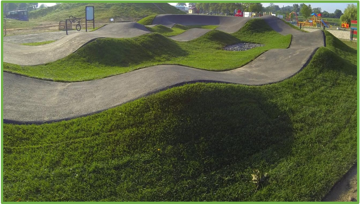
Garby o prawidłowo wyprofilowanych kształtach

Budowa torów typu pumptrack wraz z placami do wypoczynku i elementami małej architektury w ramach zadania pn.: „Zagospodarowanie działki nr 149/4 obręb Komorowo z przeznaczeniem na tereny rekreacyjno-sportowe”